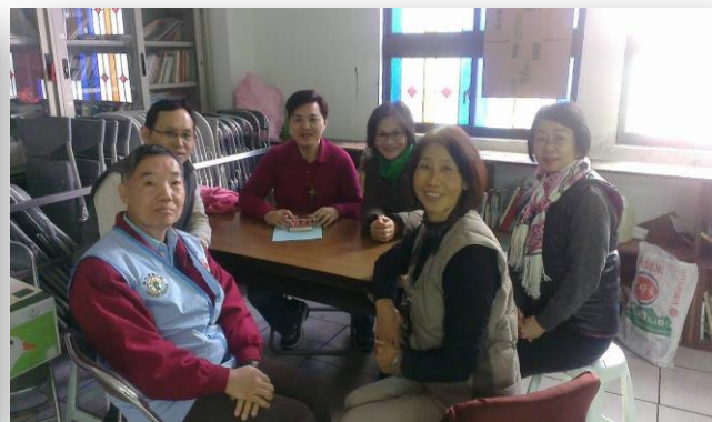
神父與勵志會活力員歡唱與分享